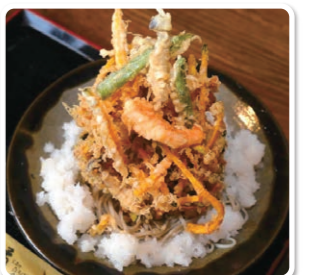
【塩屋 橋】東蒲原郡阿賀町津川3508