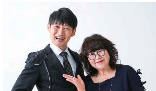
自身の人脈を活かした営業からラジオ出演まで。NAMARA芸人の魅力を全力で発信中です!