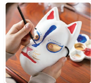
【狐の嫁入り屋敷】東蒲原郡阿賀町津川3501-1

2つ目はそば処「塩屋 橋」です。江戸時代の塩問屋を再現した趣ある建物で、西会津産のそば粉を使った十割そばが味わえます。コシと風味が豊かなそばは、つゆとの相性も抜群で、「かき揚げおろしそば」は名物の一杯です。津川エリアならではの魅力をぜひ体感してください。